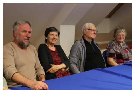
Střípky z výročních valných hromad našich pačejovských spolků, hasičských sborů a klubů.