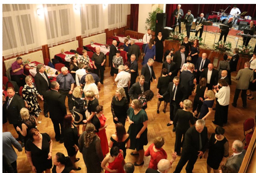
Obecní spolkový ples