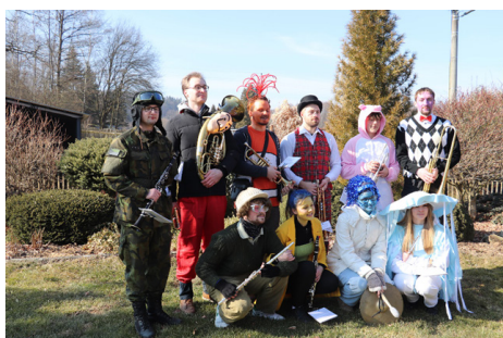
Masopustní průvod Velešice