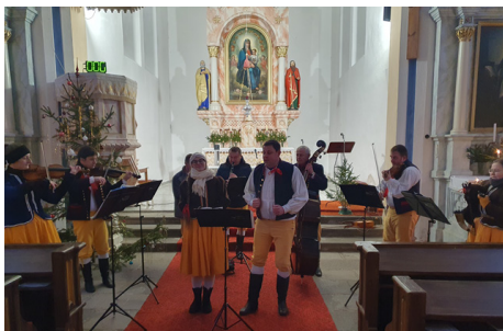
Vystoupení souboru MLS v pačejovském kostele

Toto období je vždy ve znamení výročních schůzí a valných hromad našich zájmových spolků. Rok jsme ale zahájili novoročním koncertem v pačejovském kostele, na kterém vystoupil Malý lidový soubor MLS z Plzně. Výroční valné hromady konaly všechny tři hasičské sbory, Sokol Pačejov, Spolek pro obnovu památek předků, Včelařský spolek, středisko skautů a Automotoklub. 22. února se konal 67. ročník masopustního průvodu ve Velešicích, který tradičně organizují velešičtí hasiči. Letos jim přálo počasí a za účasti 60 masek prošel Velešice a Týřovice. Poslední únorový pátek se konalo v předsáli kulturního domu posezení s trampskou písničkou, aby se přivolalo jaro. Březen byl ve znamení konání obecního spolkového plesu.